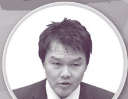
新潟県議会議員 高橋 直揮氏

日時 2014年 10月17日 金 19:00～20:50 (受付開始 18:30～)